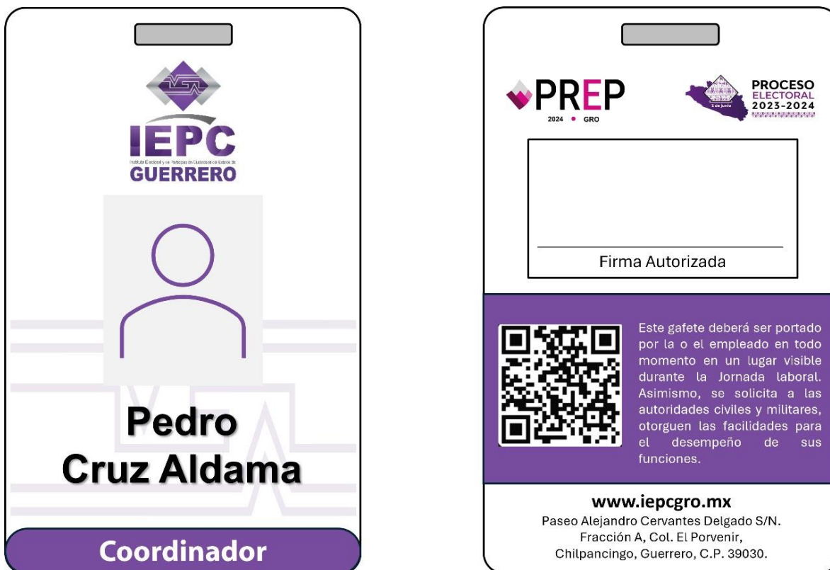
Tabla 1. Diseño de gafetes

No se permitirá el uso de dispositivos móviles de comunicación o fotográficos al interior de las instalaciones, salvo el autorizado por el IEPC Guerrero .